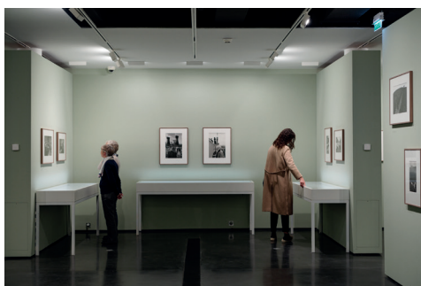
002 Fondation HCB, 79 rue des Archives, novembre 2018 Salle H, salle d'expositions Exposition Martine Franck