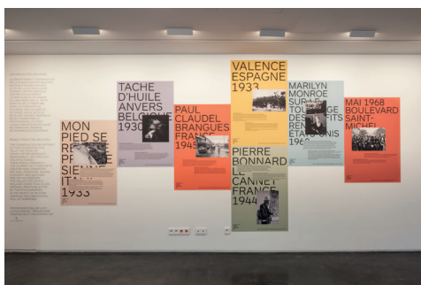
003 Fondation HCB, 79 rue des Archives, novembre 2018 Perles des Archives