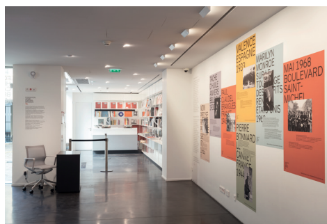
004 Fondation HCB, 79 rue des Archives, novembre 2018 Perles des Archives et librairie