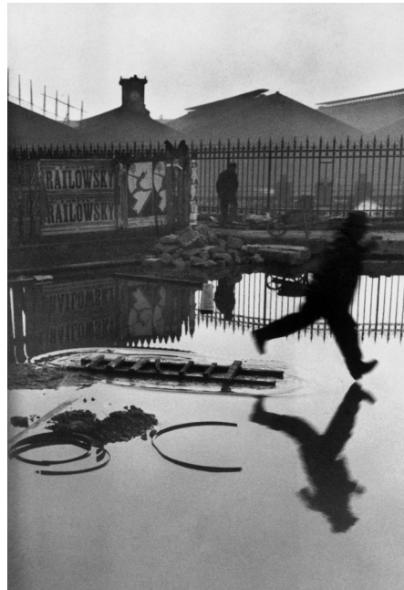
Derrière la gare Saint-Lazare, Place de l'Europe, Paris, 1932