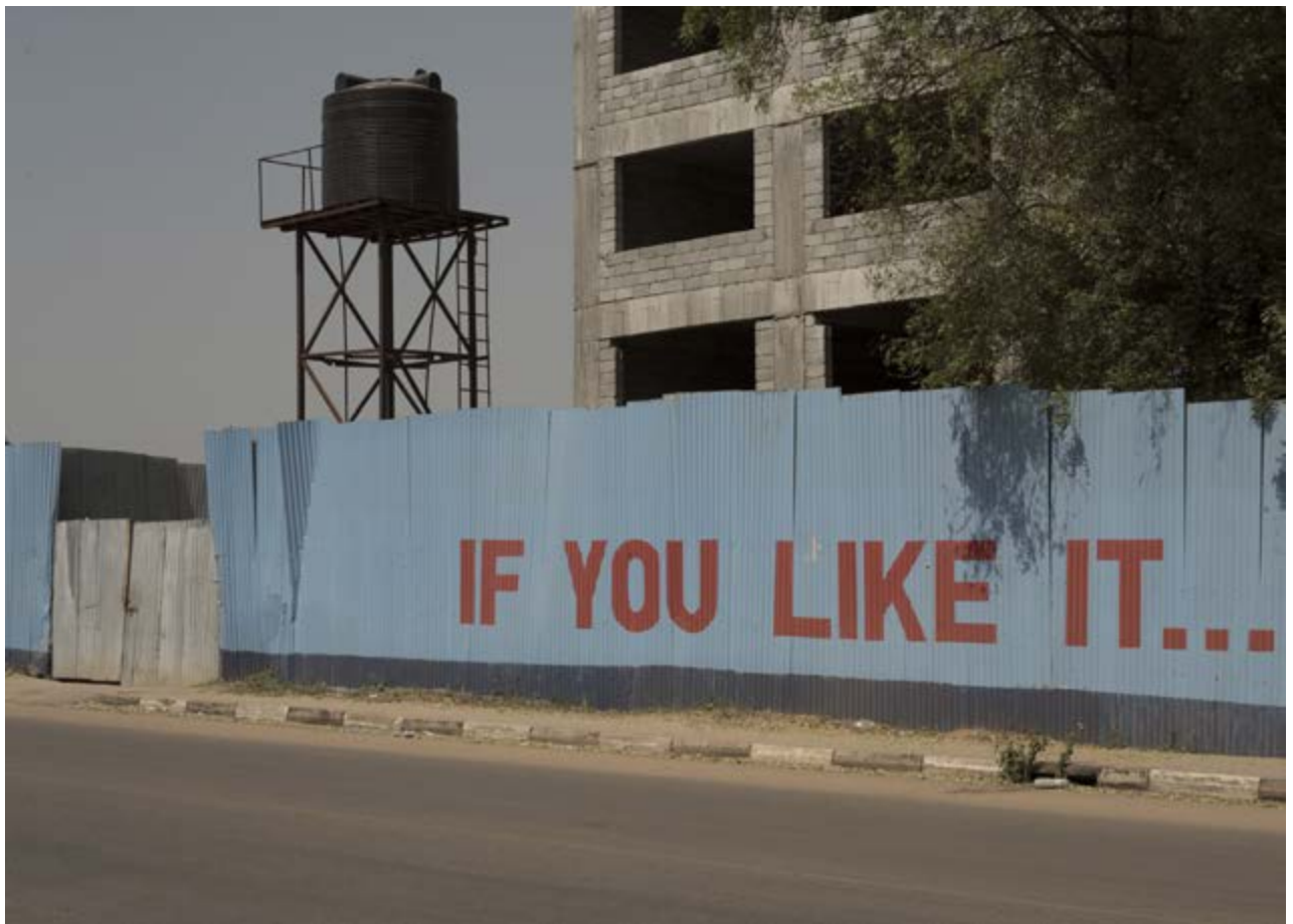
L1000125. Chantier / Quartier Hai Jalaba / Juba / 2015

« Le livre et l'exposition sont pour moi des espaces d'expérience à mener par le jeu, avec l'intuition pour guide. » Claude Ivemé