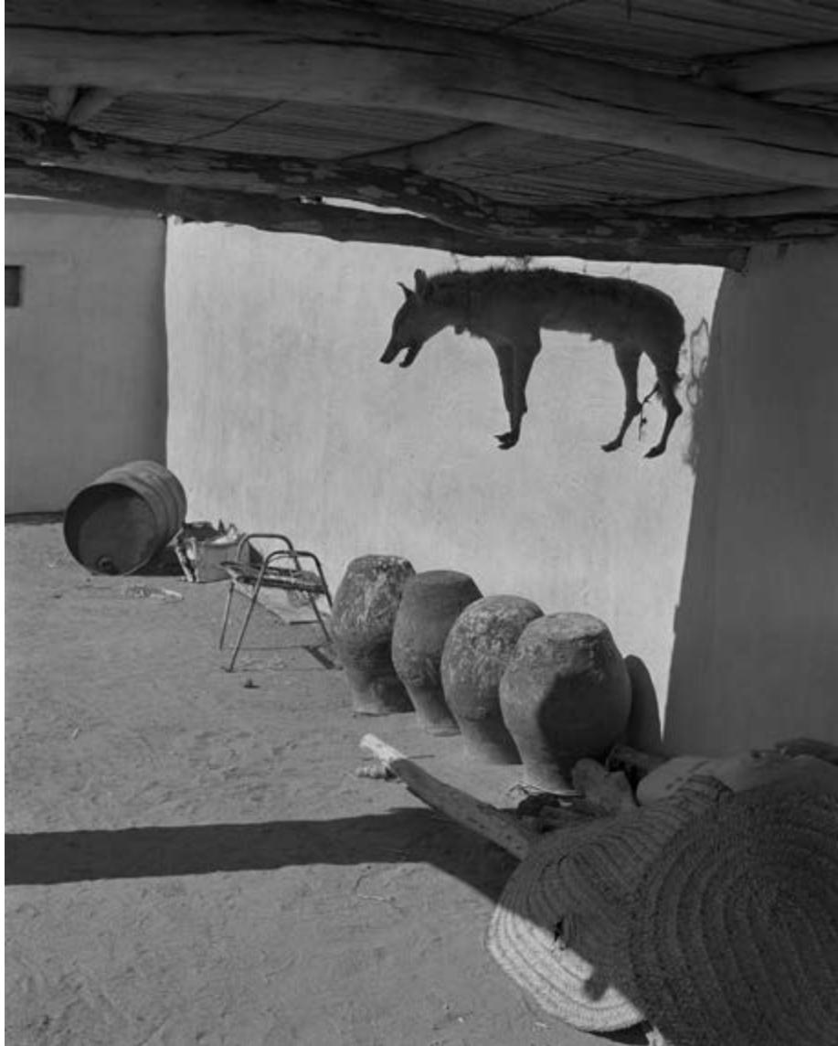
306-68. Chien naturalisé / Toshka / Dar Sukkot / Nubie / Févr. 2002

« Rien ici n'est vérité, c'est dans les failles, entre les lignes, que germe l'imaginaire. » Claude Iverné