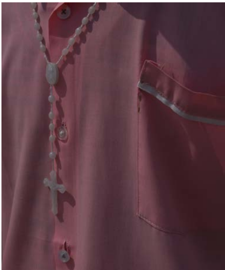
L1009520. École secondaire / Église adventiste du septième jour / Quartier Hai Kuwait / Juba / Déc. 2015

« La tentation de clore, mais danser encore, juste encore un peu. L'invitation à poursuivre, prolonger l'errance dans le brouhaha de la couleur. » Claude Ivomé