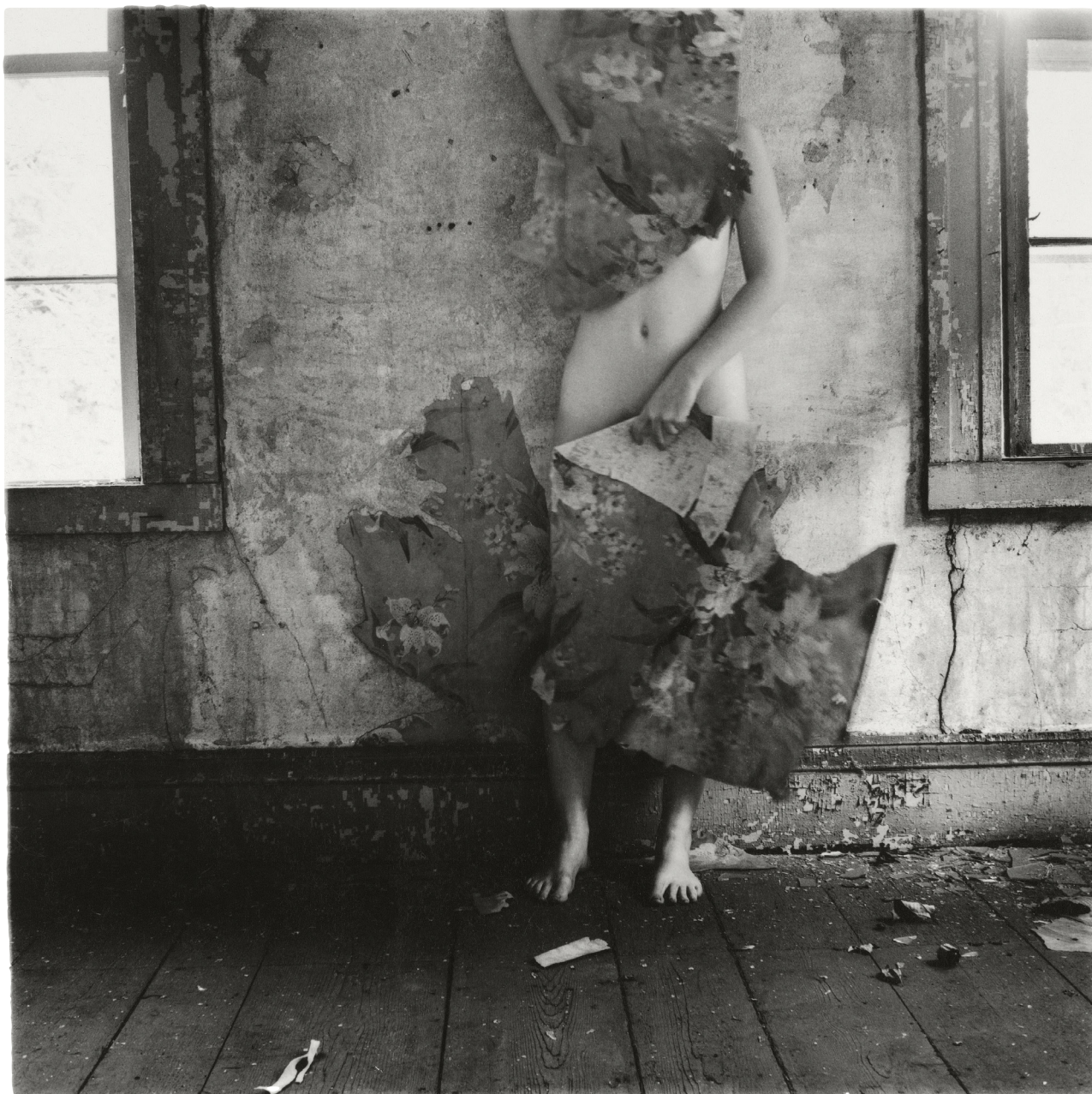
Francesca Woodman, From Space 2 , Providence, Rhode Island, 1976

Ce qui s'est passé, c'est que j'ai joué du piano pendant longtemps, surtout des variations, du Scarlatti, etc. La même chose se produit dans mes images. F.W.