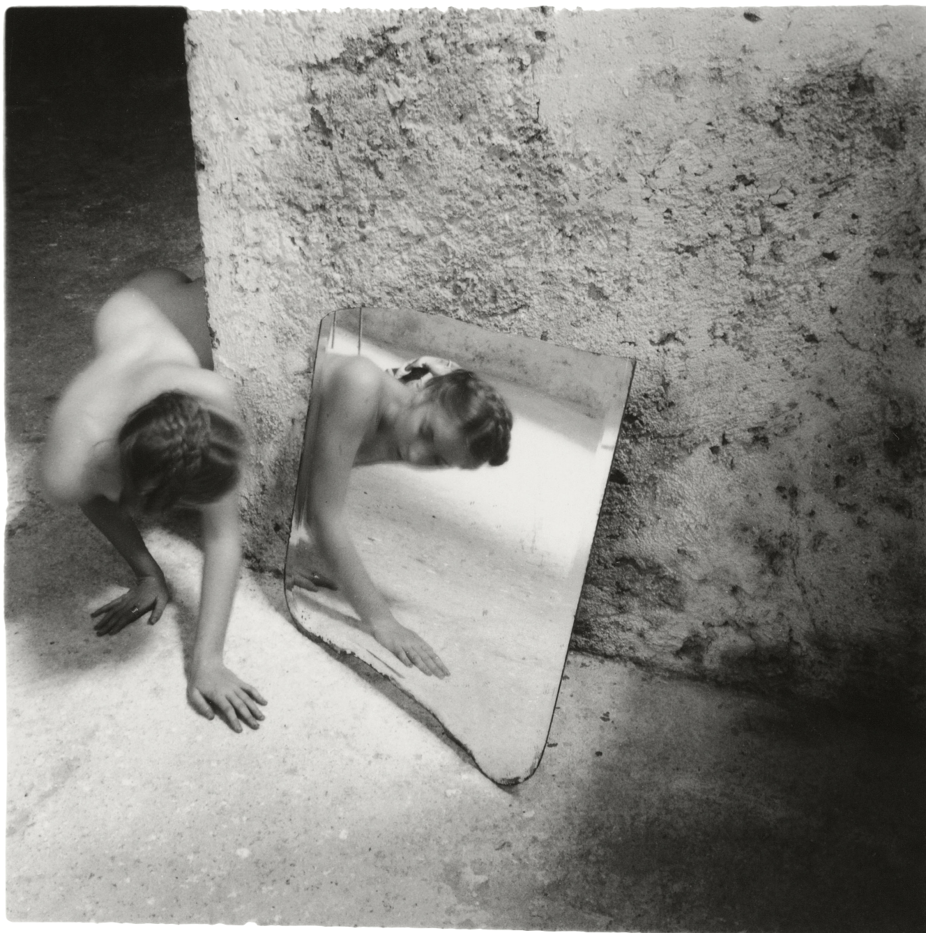
Francesca Woodman, Self-deceit #1 , Rome, Italy, 1978

> Petit déjeuner presse 10 mai 10h - 12h