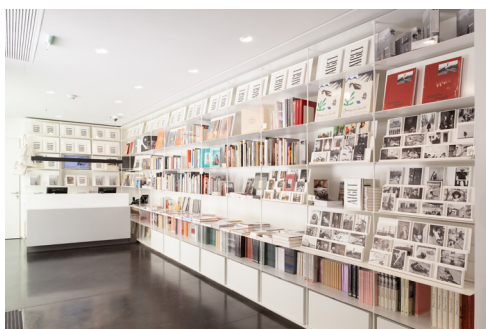
02 | Fondation HCB, 79 rue des Archives, juin 2021 Accueil et librairie