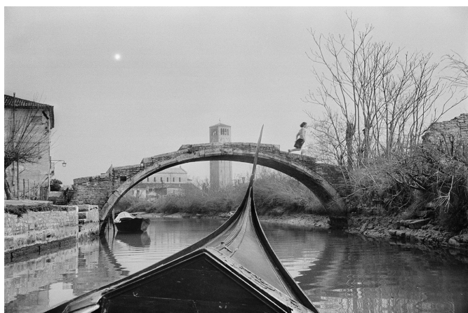
02 | Torcello, Italie, 1953