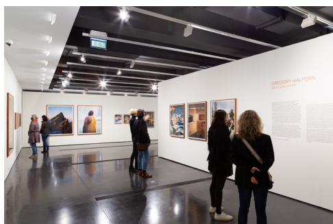
03 | Fondation HCB, 79 rue des Archives, octobre 2020 Exposition Gregory Halpern