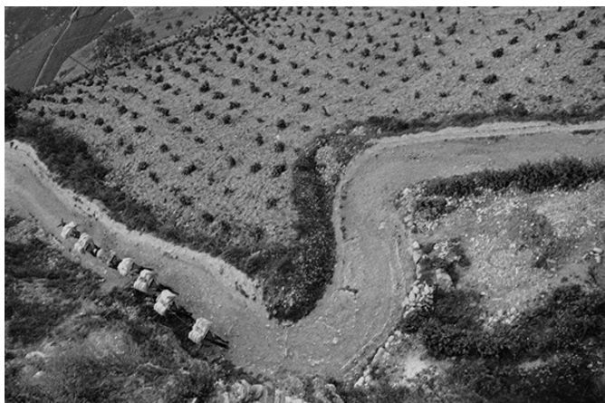
05 | Espagne, 1933