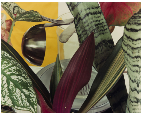
Jan Groover, Sans titre , ca.1978 © Musée de l'Elysée, Lausanne - Fonds Jan Groover