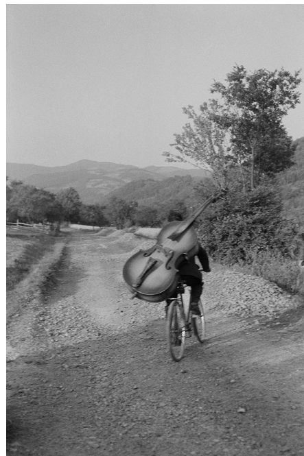
Serbie, 1965

Avec cette sélection de 70 photographies, Henri Cartier-Bresson dévoile en creux l'autoportrait d'un artiste solitaire en plein questionnement sur son rapport au monde. L'exposition est complétée par une sélection de dessins de l'artiste issus des collections de la Fondation HCB : une traversée de l'œuvre d'Henri Cartier-Bresson par un cheminement propice à la contemplation.