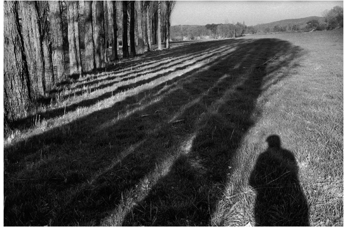
Autoportrait, Provence, France, 1999

Celui que l'on surnomme « l'œil du siècle » a été le témoin des grands événements du XX ème siècle : funérailles de Gandhi en Inde, derniers jours du Kuomintang en Chine, premières photographies de l'URSS... À sa disparition en 2004, il laisse derrière lui un patrimoine unique dans l'histoire de la photographie, qui fait sans cesse l'objet de nouvelles interprétations.