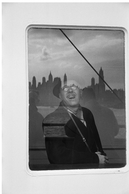
01 | New York, États-Unis, 1959

Les visuels doivent être accompagnés de leurs légendes et copyrights. Aucun visuel ne peut être recadré. La publication des visuels est limitée à deux par support.