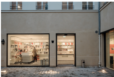
01 | Fondation HCB, 79 rue des Archives, novembre 2018 Accueil