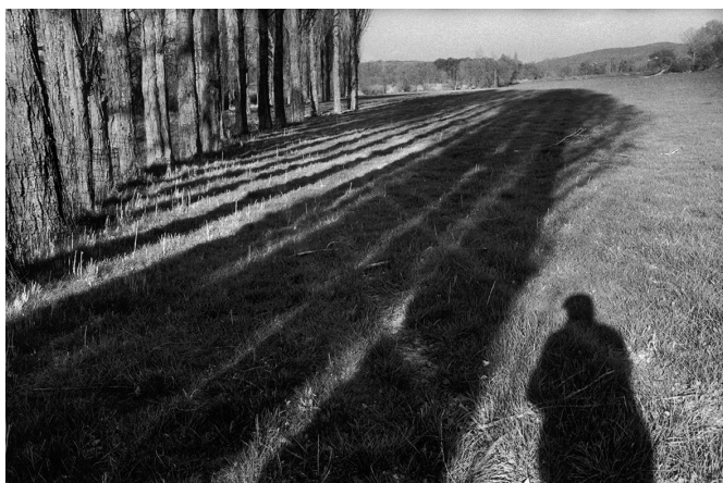
10 | Autoportrait, Provence, France, 1999