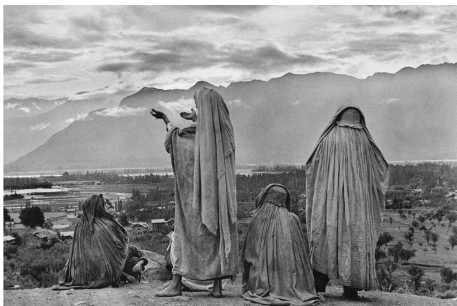
09 | Srinagar, Cachemire, Inde, 1948