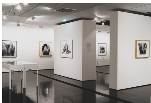
05 | Fondation HCB, 79 rue des Archives, octobre 2021 Exposition John Coplans