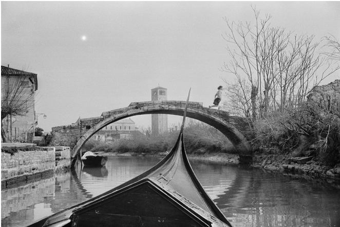
Torcello, Italie, 1953

Sélectionnées par Henri Cartier-Bresson (1908-2004) à la fin de sa vie, les photographies de l'exposition L'expérience du paysage témoignent de l'approche de « l'œil du siècle » face à ce qui n'est pas simplement un décor pour observer l'être humain, mais un sujet à part entière. Chacune de ces images, prises entre les années 1930 et les années 1990 en Europe, en Asie et en Amérique, illustre la construction du paysage par le photographe, qu'il soit naturel ou urbain.