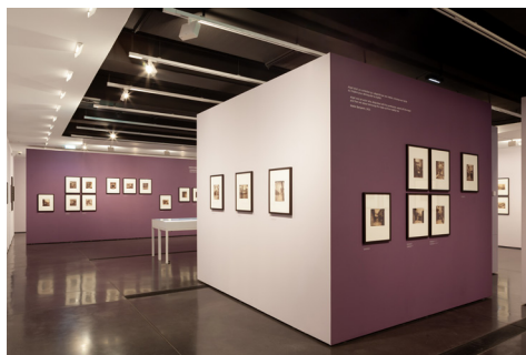
04 | Fondation HCB, 79 rue des Archives, juin 2021 Exposition Eugène Atget