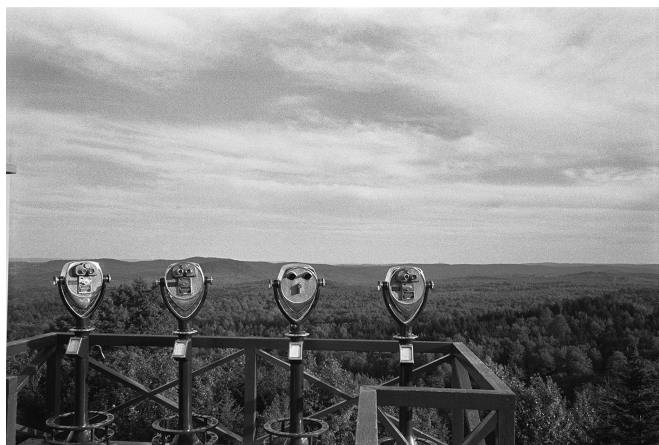
07 | Vermont, Côte Est, Etats-Unis, 1960 © Fondation Henri Cartier-Bresson / Magnum Photos