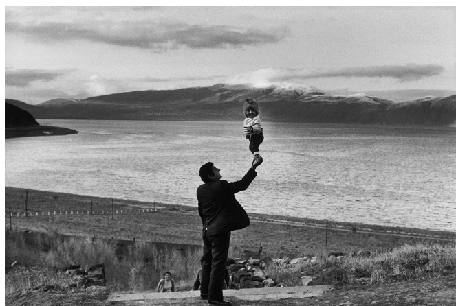
04 | Lac Sevan, Arménie, Union Soviétique, 1972