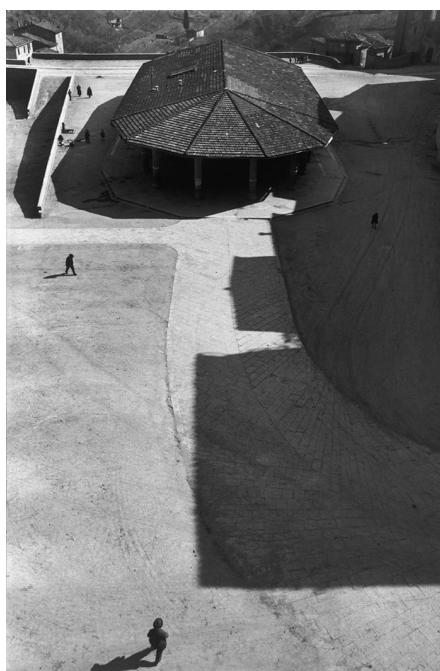
08 | Sienne, Italie, 1933