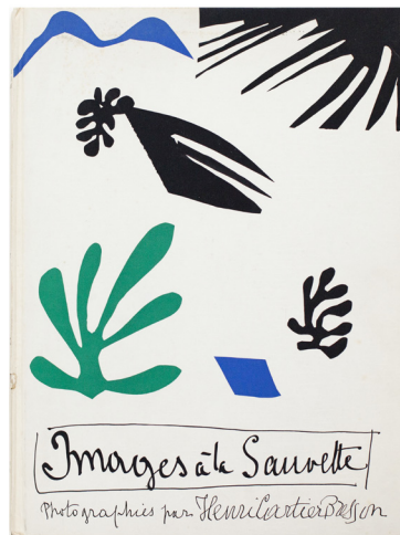
Images à la Sauvette (Verve, 1952), couverture