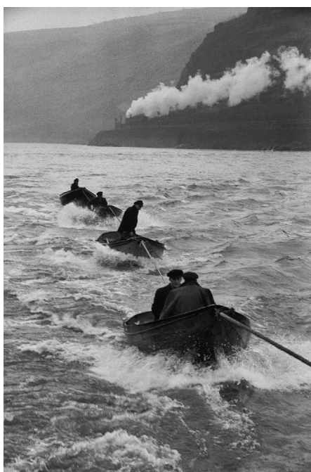
06 | Le Rhin, Allemagne, 1956