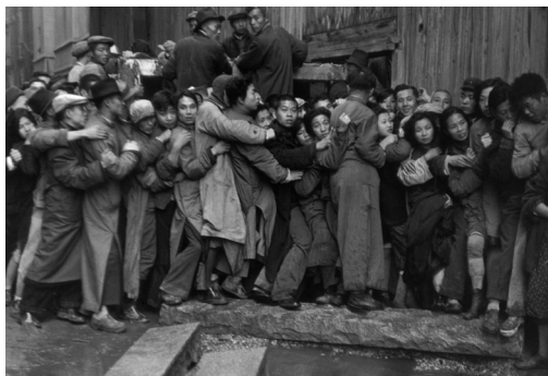
Gold Rush. En fin de journée, bousculades devant une banque pour acheter de l'or. Derniers jours du Kuomintang, Shanghai, 23 décembre 1948.