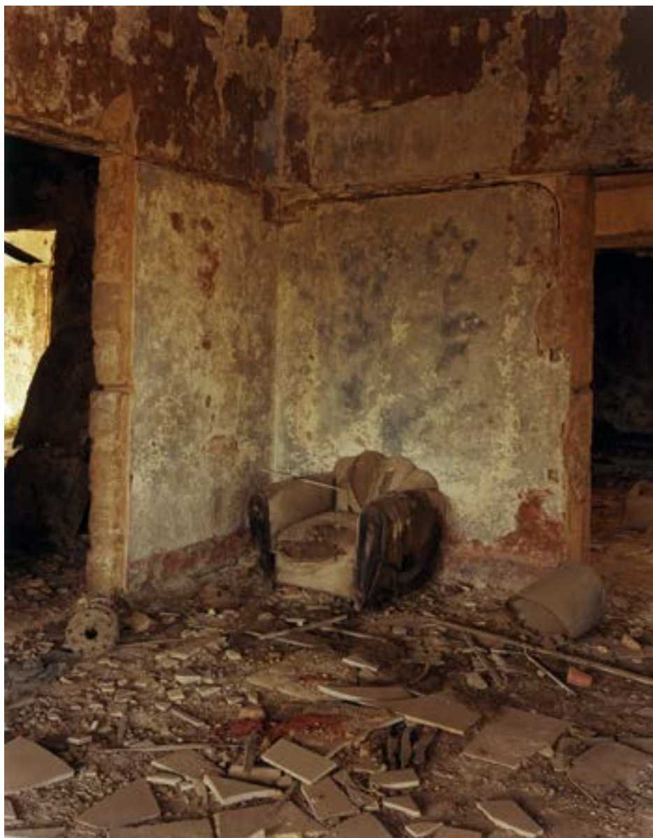
Ancienne maison close, Beyrouth, Liban, 1991

« Je suis un photographe français dans Beyrouth centre-ville je marche dans la rue la lumière des murs me rassure elle me guide dans un bonheur bonheur de travailler avec un gros appareil finie la course aux francs-tireurs il n'y a plus d'ennemis je reviens sur les lieux de la guerre sur les lieux du reporter je ne perds pas le nord je sais toujours où est l'est et l'ouest. Si les autobus-barricade ont disparu les immeubles sont les mêmes c'est bien la même ville j'aime cette ville aujourd'hui libre. »