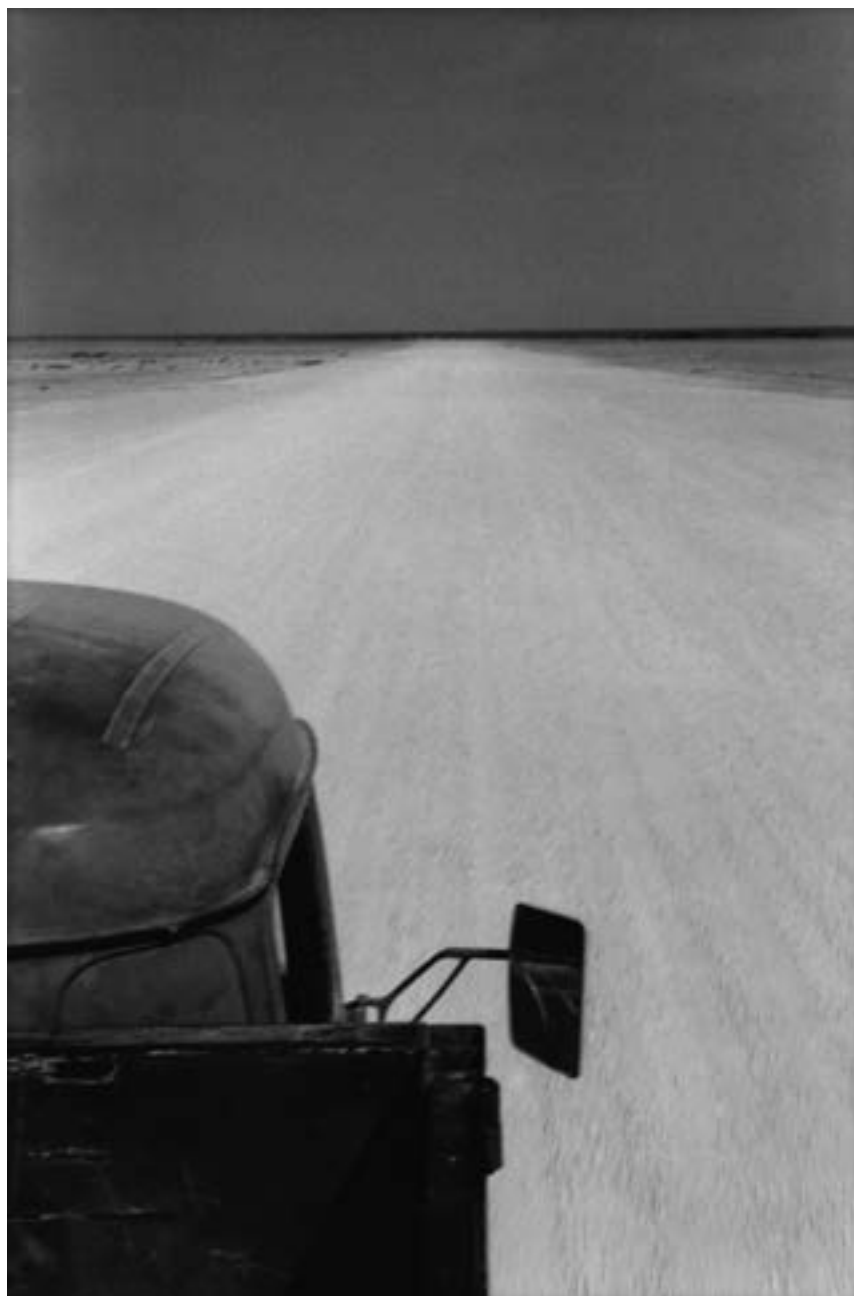
Îles Dahlak, Érythrée, 1995

Petit déjeuner presse : mardi 12 septembre 9h - 12h