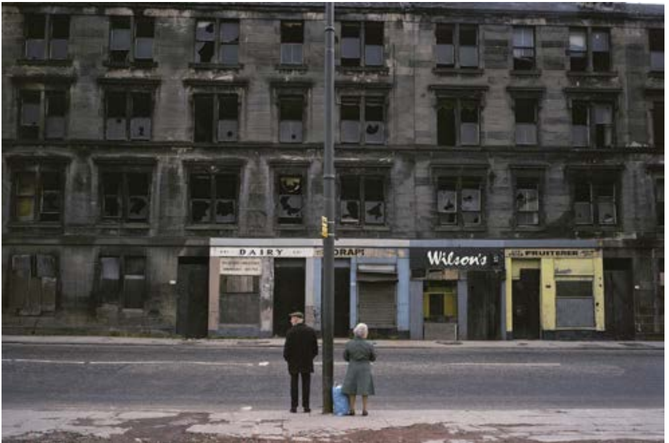
Glasgow, Écosse, 1980

« Voyager, et n'être rien du tout Ni touriste, ni reporter Ne chercher aucune performance Ne rien chercher à prouver »