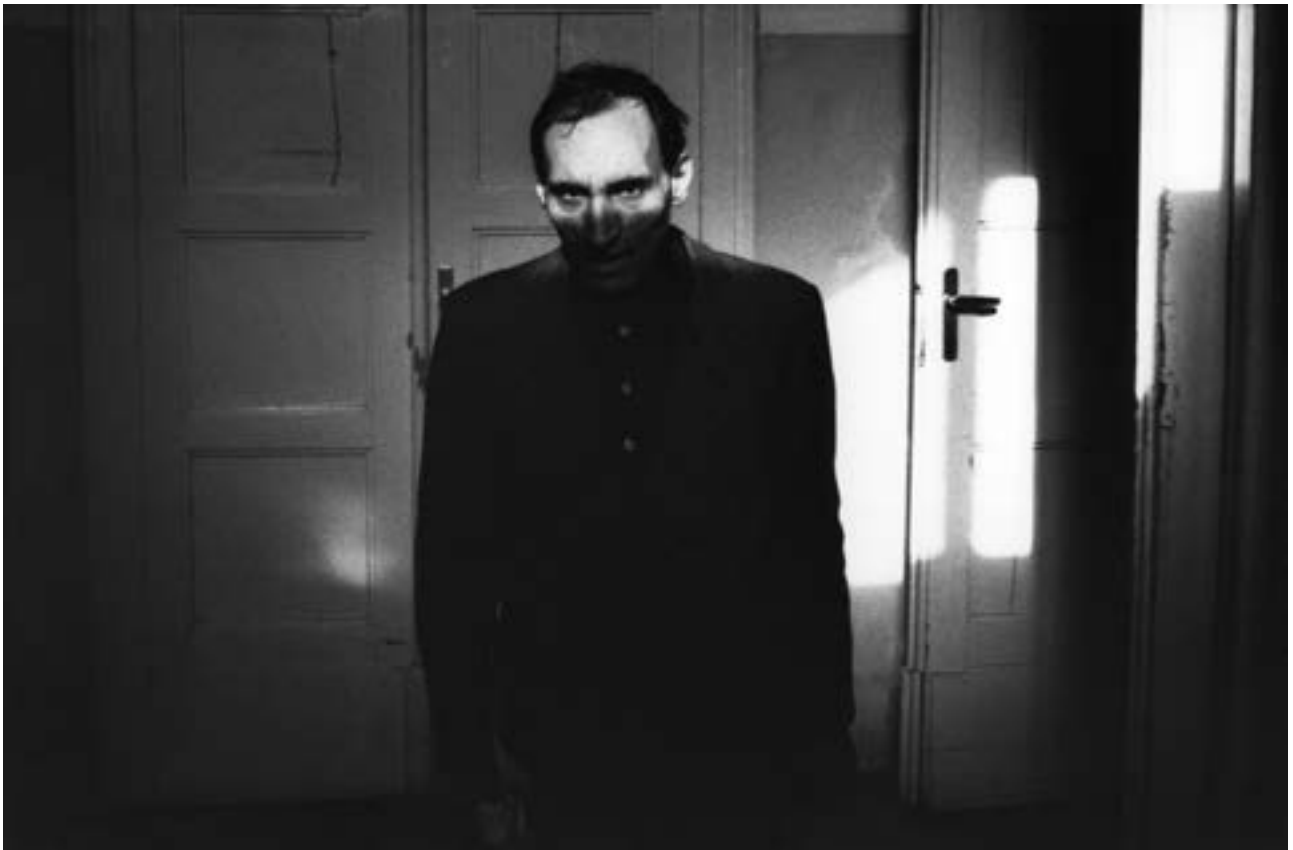
Hôpital psychiatrique Collegno, Turin, Italie, 1980

« Le photographe est là, il ressemble à un nouvel arrivant, à un nouveau pensionnaire, on le voit tous les jours, ce n'est ni un médecin ni un infirmier, il n'est pas du métier, il tourne lui aussi, il cherche quelque chose, il a l'air sympathique, pas encore très à l'aise, il ne parle pas.