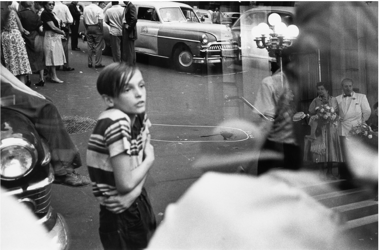
Accident, New York, 1952