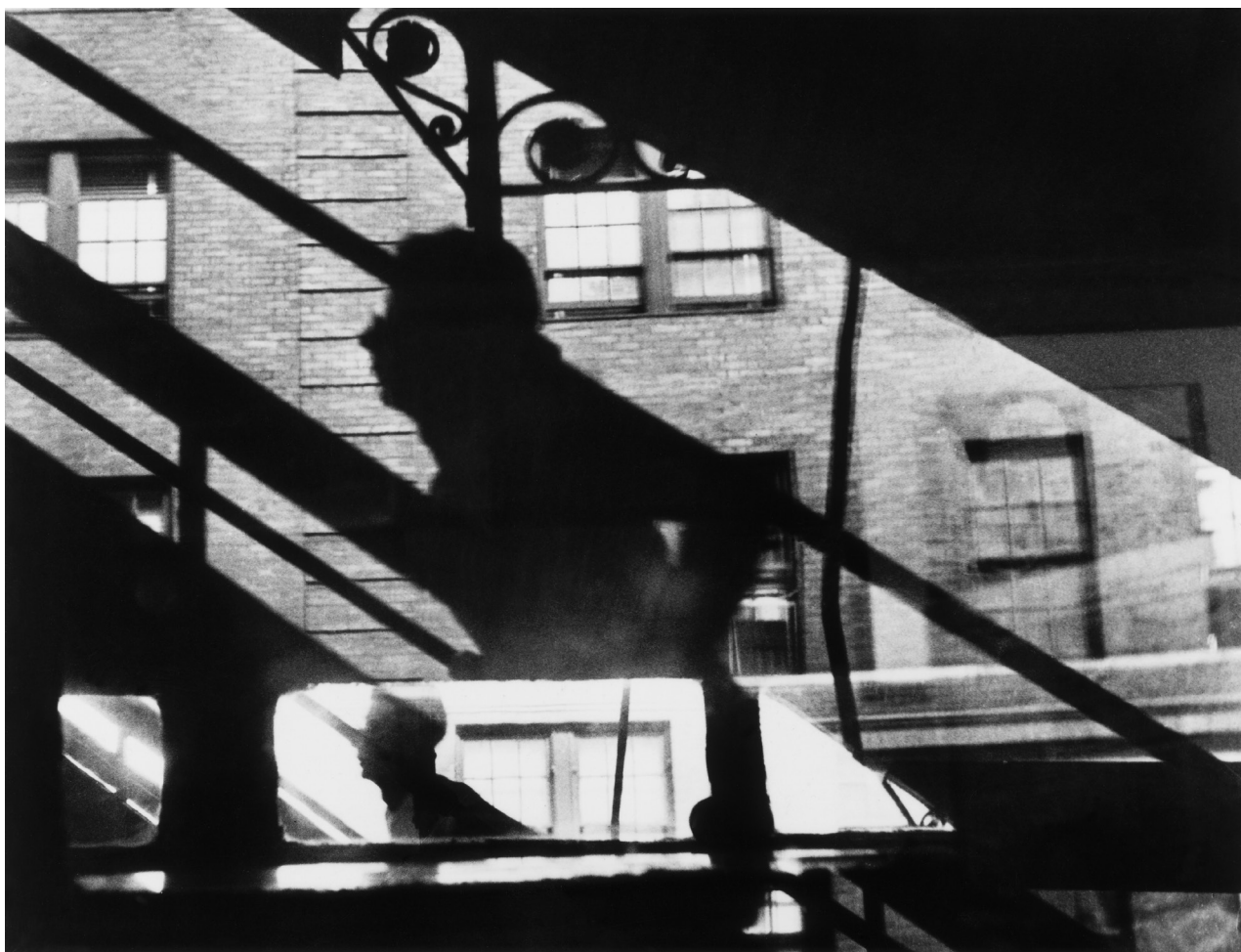
Louis Faurer, « Win, Place, and Show, » métro aérien de la 3 e Avenue à la 53 e rue, New York, c.1946-1948

Cependant, avec une soudaineté frappante, j'ai pensé en 1976 que la photographie américaine en ce milieu du siècle appartenait à Louis Faurer. Walter Hopps