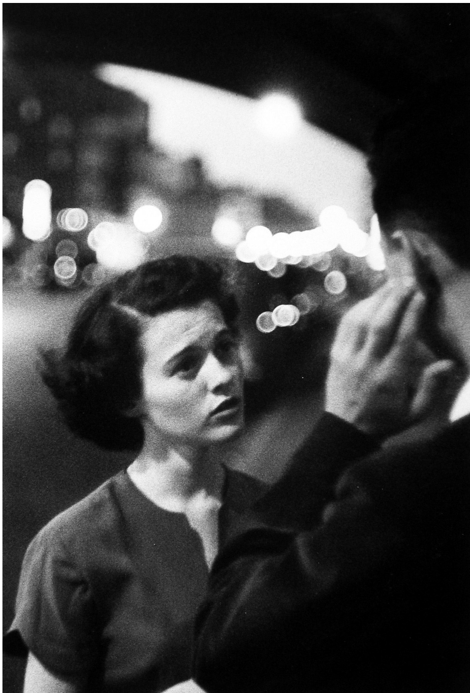
Louis Faurer, Sourds-muets, New York, 1950 © Louis Faurer Estate