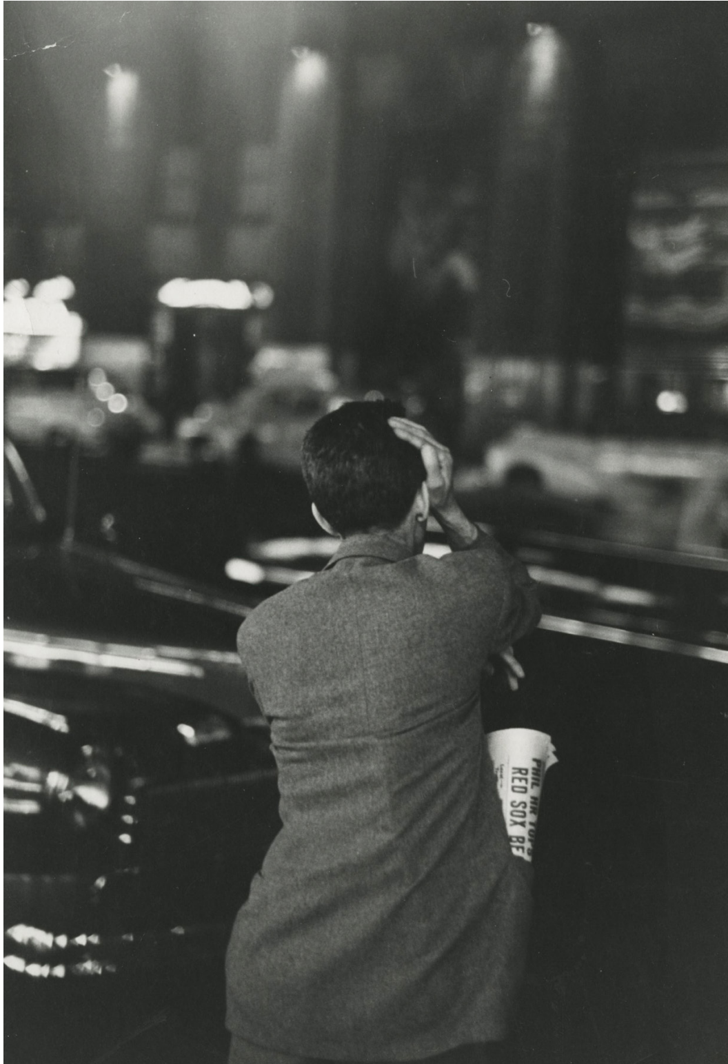
Louis Faurer, 42 e rue , New York, c. 1948

“J’ai le désir intense d’enregistrer la vie comme je la vois, comme je la sens. Tant que je serai stupéfait par cet étonnement, tant que je sentirai que tous les événements, messages, expressions, mouvements, tiennent tous du miracle, je me sentirai rempli de certitude pour continuer. Ce jour-là, tous mes doutes s’évanouiront.”