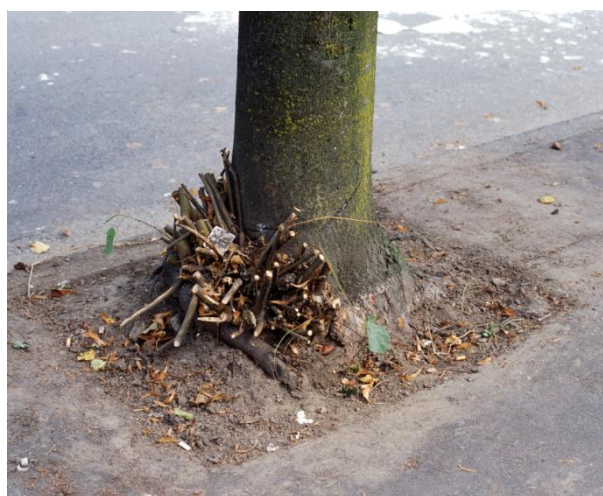
Clipped Branches, East Cordova St., Vancouver , 1999 Transparent dans caisson lumineux