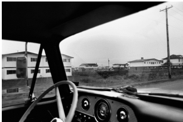
After "Landscape Manual", 1969/2003 Tirage gélatino-argentique