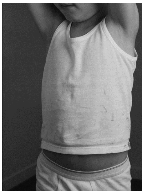
Torso , 1997 Tirage gélatino-argentique