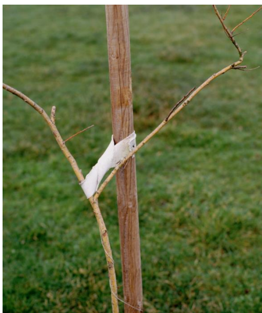
A sapling supported by a post , 2000 Transparent dans caisson lumineux