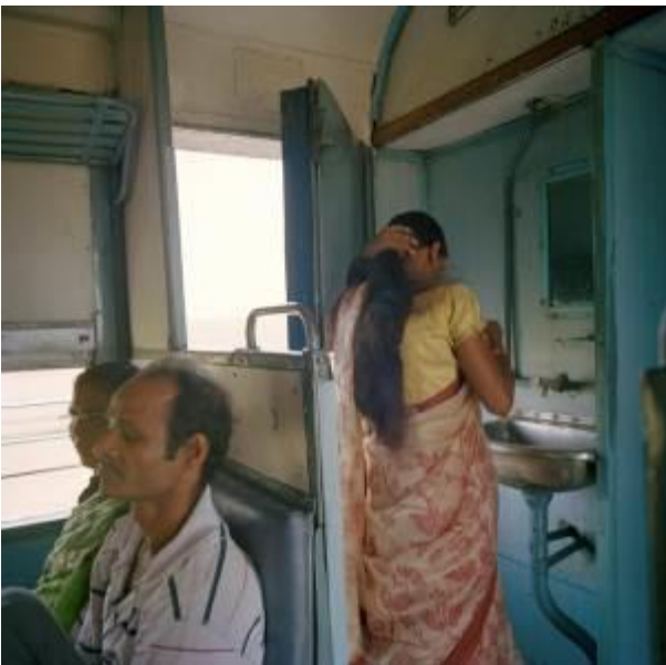
Dans le Santiniketan Express, mai 2014

Pour les demandes de visuels haute-définition : jessica.retailleau@henricartierbresson.org