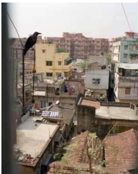
Vue du quartier de Lake Town (au nord de la ville ) depuis l'appartement de Shreyasi Chatterjee et Mrityunjoy Mitra, son mari, Kolkata, mars 2011