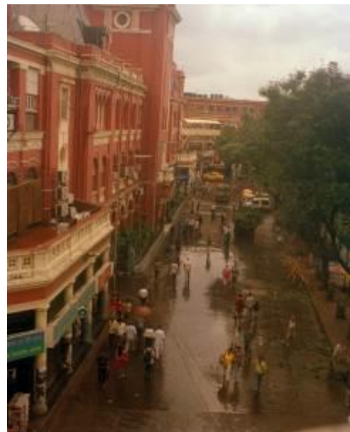
Le New Market (construction britannique) vu depuis la chambre 239 au deuxième étage de l'Oberoi Grand Hotel, pendant la mousson, Kolkata centre, juillet 2014