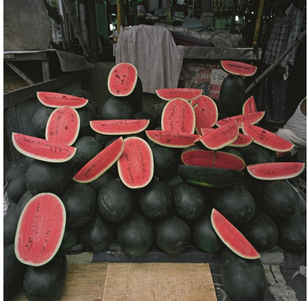
Pastèques, dans le quartier de Rajabazar, Kolkata nord, juillet 2014