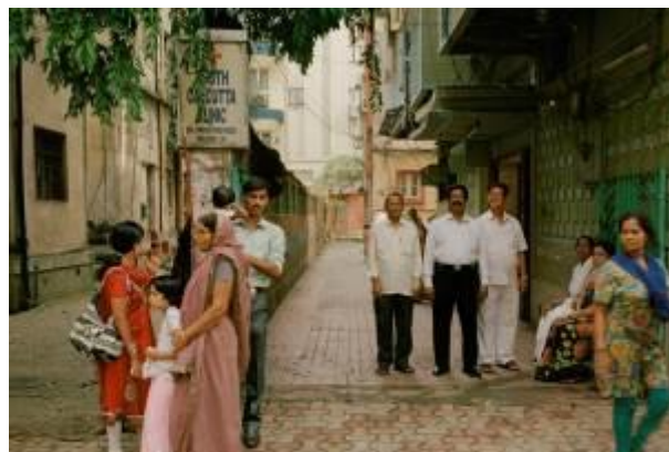
Dover Lane, Ballygunge, Kolkata sud, octobre 2014