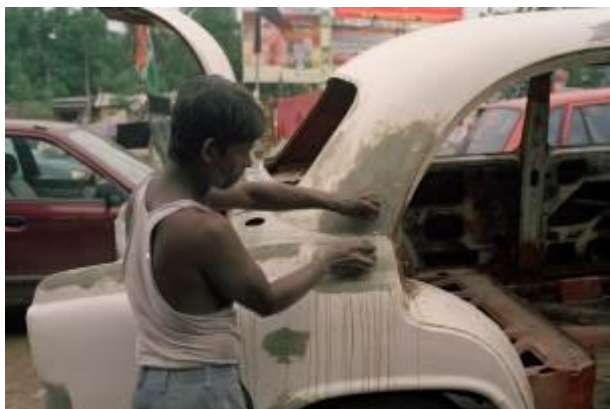
Entre Salt Lake et Kestopur, Kolkata nord-est, juillet 2014