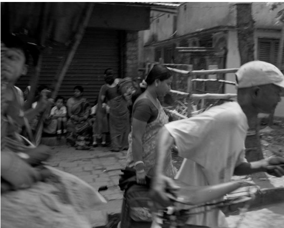
Une rue de Lake Town à la sortie de l'école, mars 2011