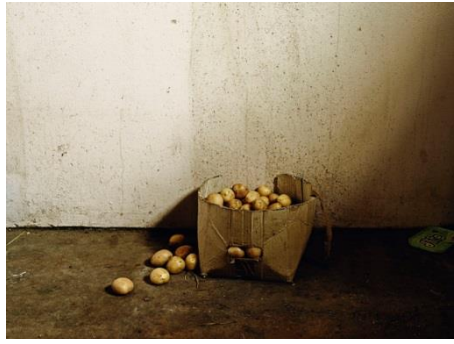
La maison des Besters, Vermaaklikheid, 2013