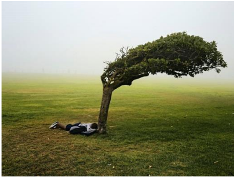
Green Point Common, Le Cap, 2013