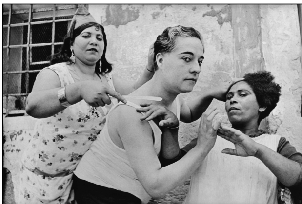
Alicante, Espagne, 1933