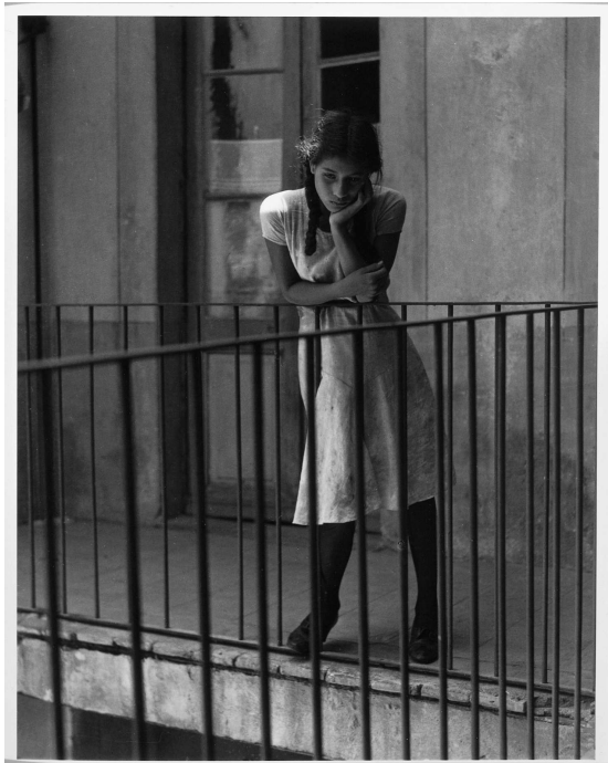
Le Songe, 1931 © Manuel Álvarez Bravo