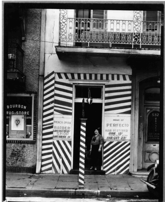
Devanture, la Nouvelle Orléans, Louisiane, 1935