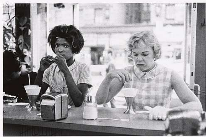
New York, 1962