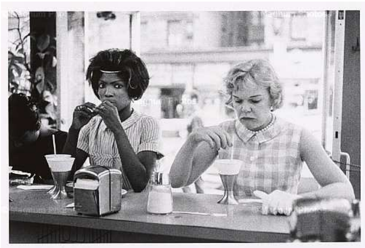
New York, 1962

L'avenir des Noirs en Amérique est le même que celui des Blancs. Nos chances sont identiques. Si vous survivez, nous survivrons. Si nous nous écroulons, vous vous écroulerez aussi.