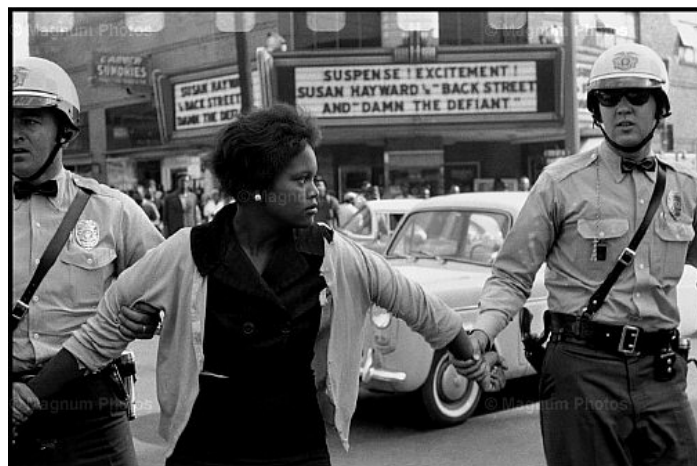
Montgomery, Alabama, 1963