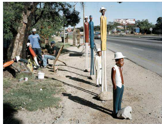
For sale on Nicol Drive, Fourways, 2004