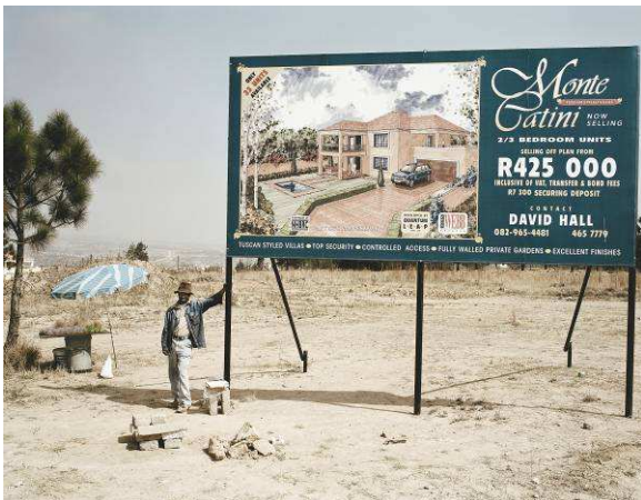
George Nkomo, vendeur des rues, Fourways, 2002