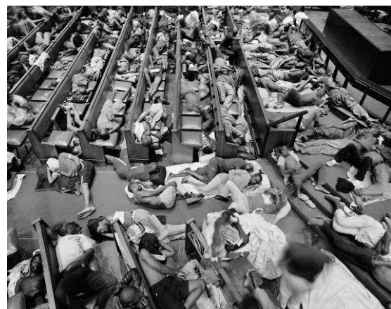
Réfugiés zimbabwéens abrités dans une église méthodiste, Pritchard Street 2009