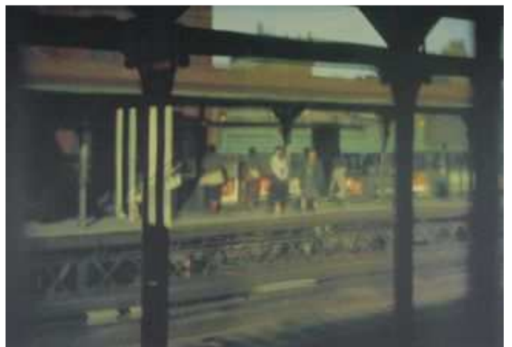
EI , New York, 1954, collection Aforge Finance