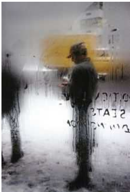
Snow , New York, circa 1960