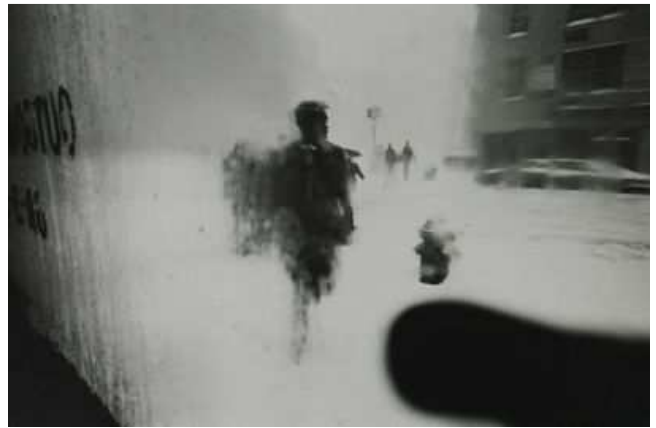
Snow, New York, 1958