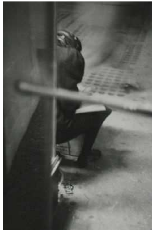
Subway Lady, New York, circa 1950