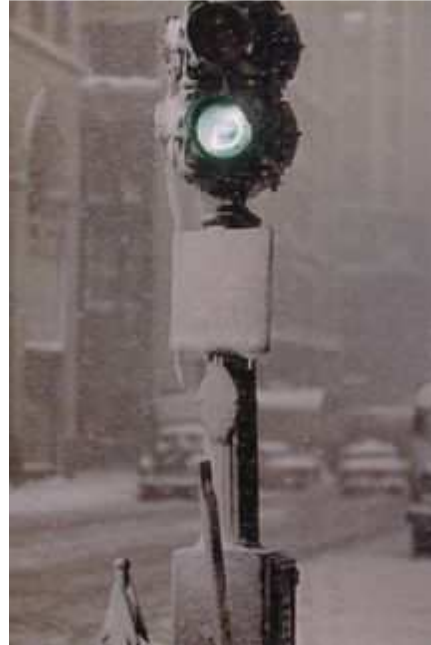
Green Light Against Grey , New York, 1955