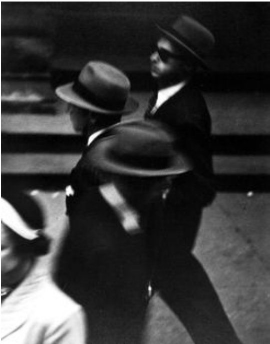
Hats, New York, circa 1948