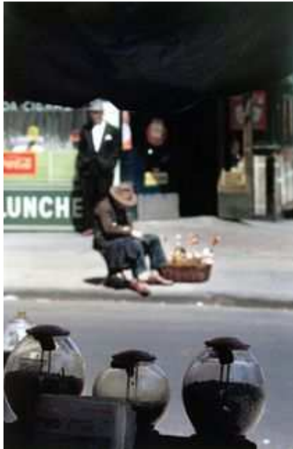
Seeds , New York, 1954 collection Aforge Finance