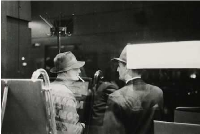
Hats, New York, circa 1958